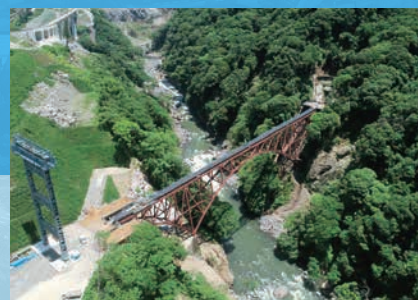
土木 第一白川橋りょう復旧工事 【熊本県】

福田組は、社是「わが社は 誠実と創造をもってこと にあたり 建設を通じ 社会に貢献します」を体現 すべく、社員一人ひとりが誠実に、技術者としての 夢と誇りをもって豊かな社会づくりに挑み続けて います。