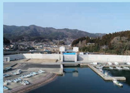
土木 綾里漁港海岸災害復旧工事 【岩手県】