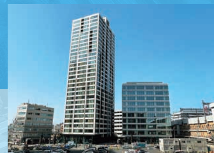
建築 アイコニックタワー・アイコニックビル 【新潟県】