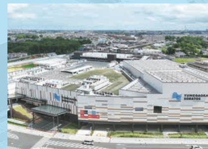
建築 ゆめが丘ソラトス 【神奈川県】